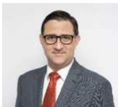
ZASTĘPCA BURMISTRZA Dzielnicy Targówek m.st. Warszawy